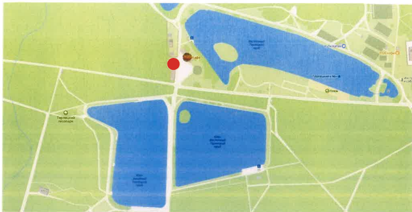
Схема расположения спортивного павильона